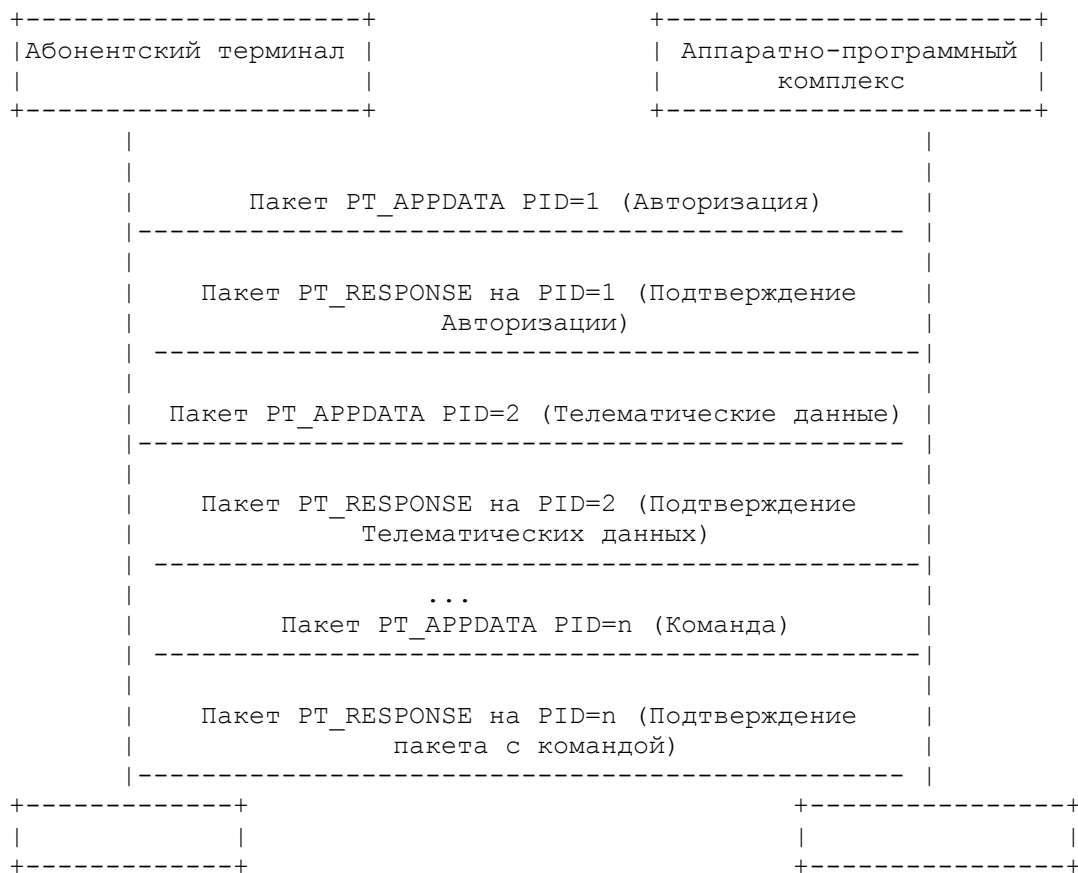
Рисунок N 3. Взаимодействие абонентского терминала и аппаратно-программного комплекса на уровне пакетов Транспортного уровня

6.12. На каждый пакет типа EGTS_PT_APPDATA или EGTS_PT_SIGNED_APPDATA, поступающий от абонентского терминала на аппаратно-программный комплекс или от аппаратно-программного комплекса на абонентский терминал, отправляется пакет типа EGTS_PT_RESPONSE, содержащий в поле PID номер пакета из пакета EGTS_PT_APPDATA или EGTS_PT_SIGNED_APPDATA. На Рисунке N 3 представлена последовательность обмена пакетами при взаимодействии абонентского терминала и аппаратно-программного комплекса.